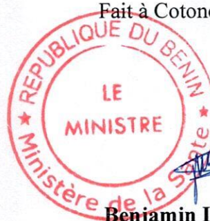
Benjamin I. B. HOUNKPATIN Ministre de la Santé